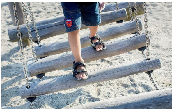
De ansatte i barnehage, skole og SFO kan skape sammenheng ved å være brobyggere mellom institusjonene. (Thoresen, Aukland 2020)

Målgruppen er alle barnehager, barneskoler og SFO i Sola. For å oppnå en god sammenheng for barnet i overgangen må barnehage – skole og SFO ha god nok kunnskap om hverandres profesjon, avklare forventninger og ha faste rammer med møtepunkt for dialog. Foreldrene er en ressurs og en viktig samarbeidspartner i dette arbeidet. SFO er ofte den første arenaen barnet møter som skolestarter. SFO står i en særstilling i mellomrommet mellom barnehage og skole, denne særstillingen og SFO sin betydning i overgangen skal få større kraft i Sola.